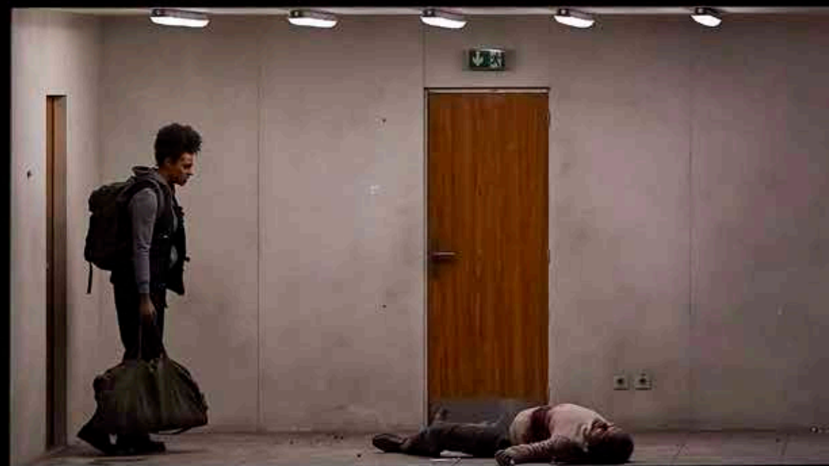
Scène uit Innocence (Finnish National Opera and Ballet)