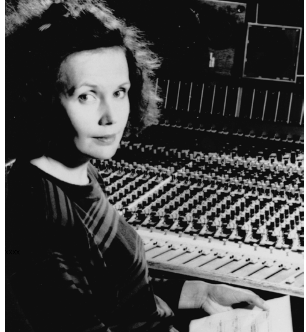
Kaija Saariaho aan het werk in IRCAM (1987)

Only the Sound Remains , een opera-tweeluik voor countertenor en bas-bariton, geïnspireerd op Japanse Noh-drama's in vertaling van Ezra Pound, gaat in wereldpremière bij De Nationale Opera. De regie is in handen van Saariaho's vaste samenwerkingspartner Peter Sellars.