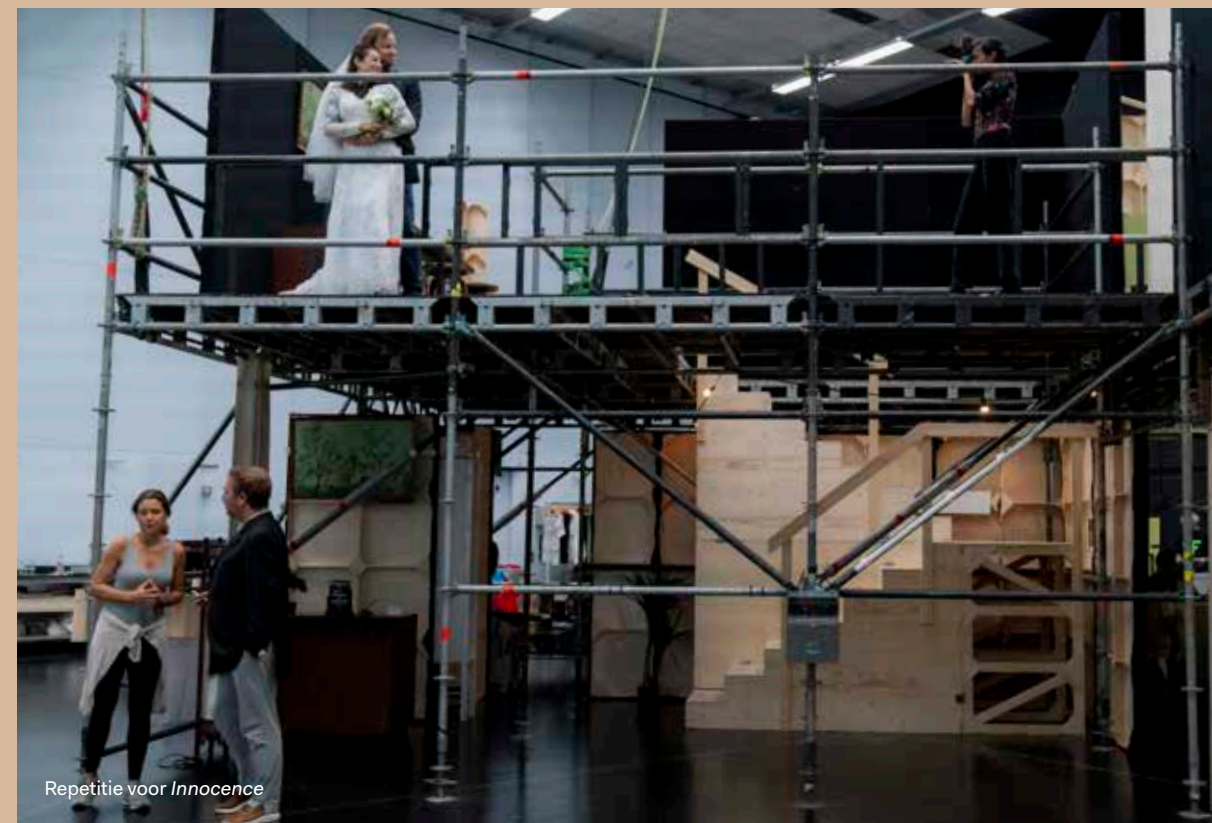
Repetitie voor Innocence