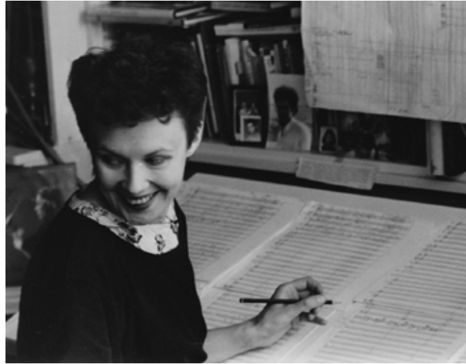
Kaija Saariaho tijdens het componeren van Verblendungen (1982-1984)