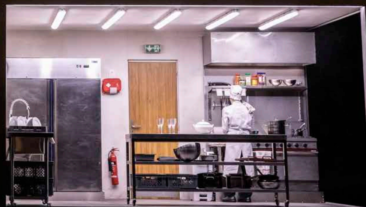
Scène uit Innocence (Festival d'Aix-en-Provence)