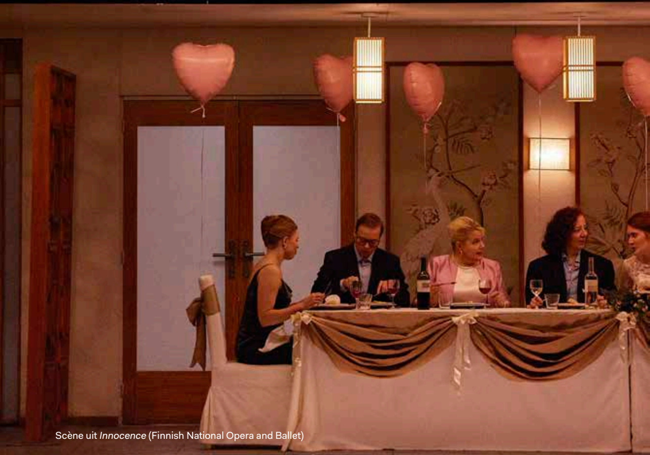
Scène uit Innocence (Finnish National Opera and Ballet)