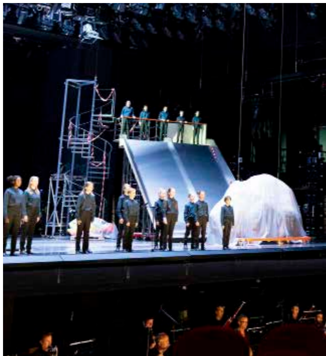
FAUST [working title]

Een bijdrage die hard nodig was om het gat van de gemiste inkomsten vanuit kaartverkoop te kunnen dichten, freelance artiesten en makers te kunnen blijven doorbetalen en nieuwe online programma's te kunnen realiseren. In 2020 heeft het Fonds de volgende activiteiten van De Nationale Opera gesteund: