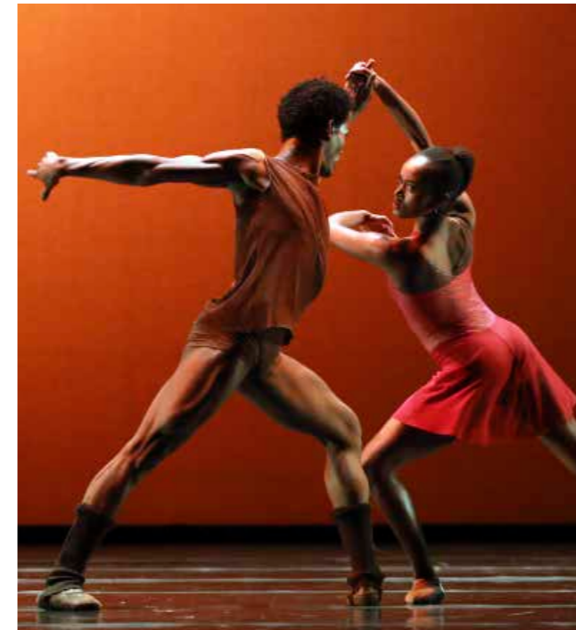
Dancing Apart Together - L'autre côté

Na de sluiting van het theater in maart 2020 verplaatste ook de programmering van Het Nationale Ballet zich overwegend naar het nieuwe online platform. Het Nationale Opera & Ballet Fonds droeg in totaal € 133.000 bij aan de online programmering van Het Nationale Ballet. Zo waren onder andere diverse grote balletklassiekers zoals The Sleeping Beauty en Het Zwanenmeer online te zien, maar ook nieuwe werken zoals Live van Hans van Manen en de twee versies van Back to Ballet , 'Classic' en 'Contemporary'. Het jaar werd in stijl afgesloten met een Kerstgala dat online bijgewoond kon worden. Ook de online balletlessen waren een groot succes met inmiddels al miljoenen views vanuit de hele wereld. Ten tijde van de sluiting van het theater vonden de balletlessen voor de dansers plaats via YouTube. De lessen waren tegelijkertijd voor iedereen toegankelijk. Zodoende kon ook het publiek vanuit huis een balletles volgen van Het Nationale Ballet.