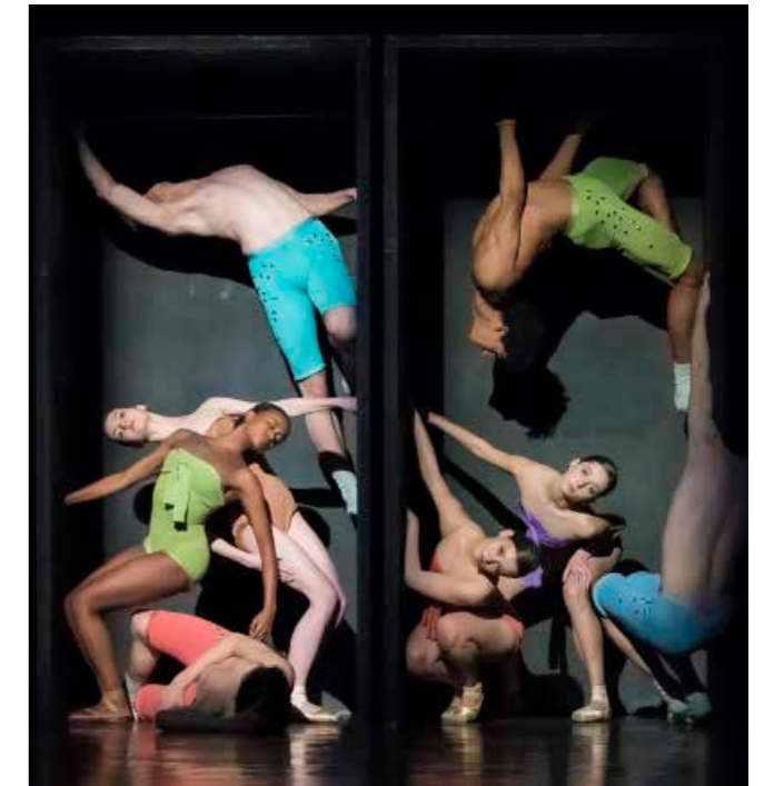
In and Out