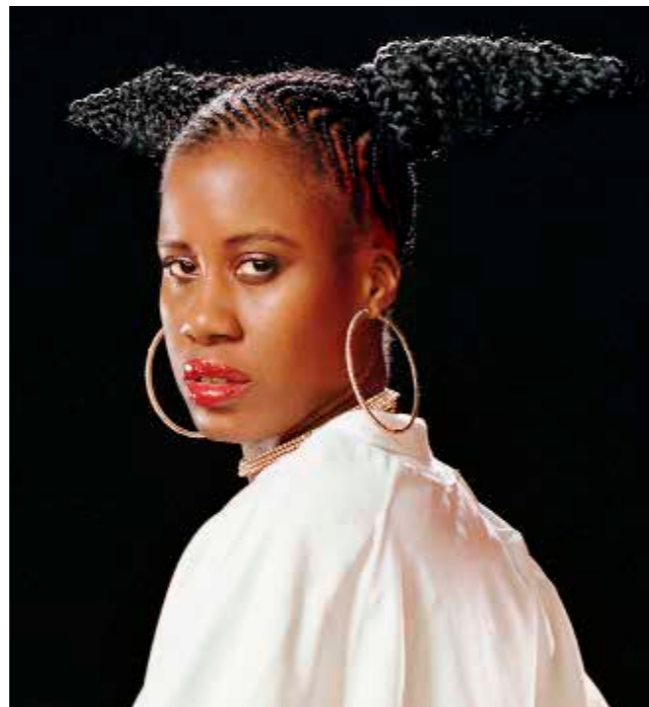
Die Frau ohne Schatten

Toen medio maart 2020 NO&B de deuren van haar theater moest sluiten is onmiddellijk de ontwikkeling gestart van een nieuw online platform: Nationale Opera & Ballet Online. Binnen twee weken na het begin van de eerste lockdown werd het platform gelanceerd en oogstte sindsdien veel succes. Op het platform zijn onder andere streams te zien van operaproducties uit eerdere seizoenen, maar ook worden er continu nieuwe online programma's gecreëerd. Hierbij werkt De Nationale Opera o.m. samen met de artistieke teams, artiesten, musici en makers die anders aan de oorspronkelijke (afgelaste) producties zouden meewerken. Het NO&B Fonds droeg in 2020 in totaal € 167.000 bij aan het ontwikkelen van nieuwe artistieke producties voor het online platform, zoals: FAUST [working title] , Le nozze di Figaro en Voices out of Silence .