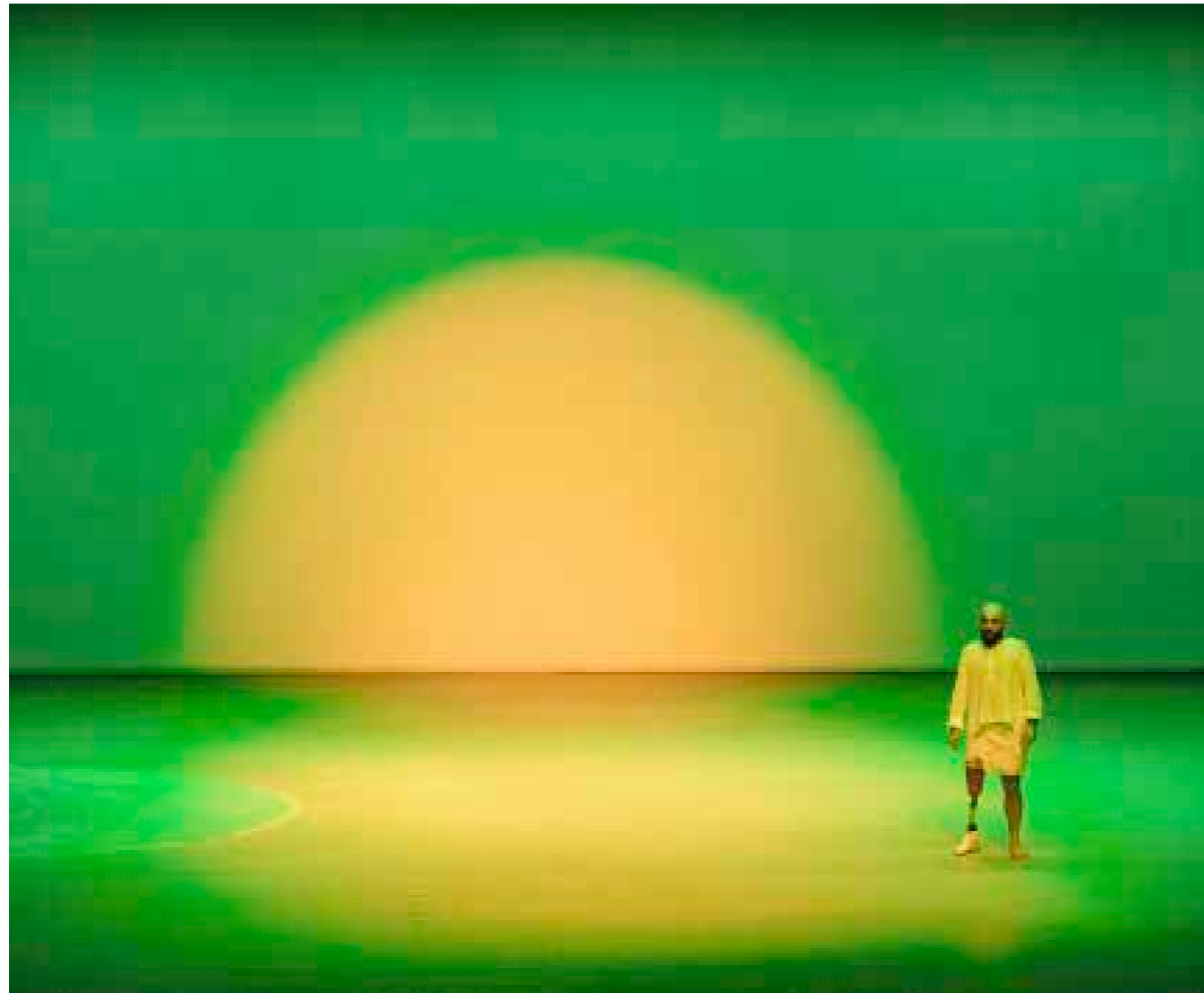
Figaro (solo): Bring me a Storm