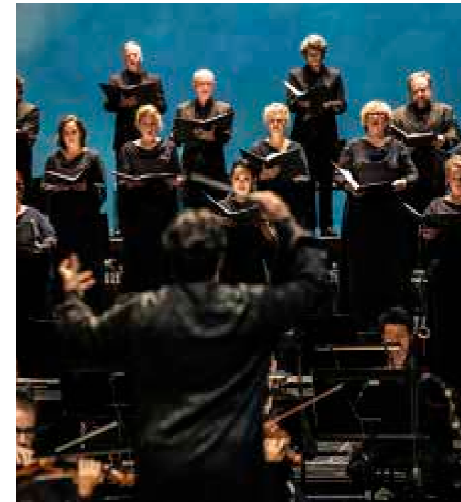
Le petite messe solennelle

Uit het beleidsplan en dit jaarverslag blijkt dat het Fonds zich inzet om (financiële) steun te werven ten behoeve van de activiteiten van het hele huis, inclusief de twee gezelschappen én het theater.