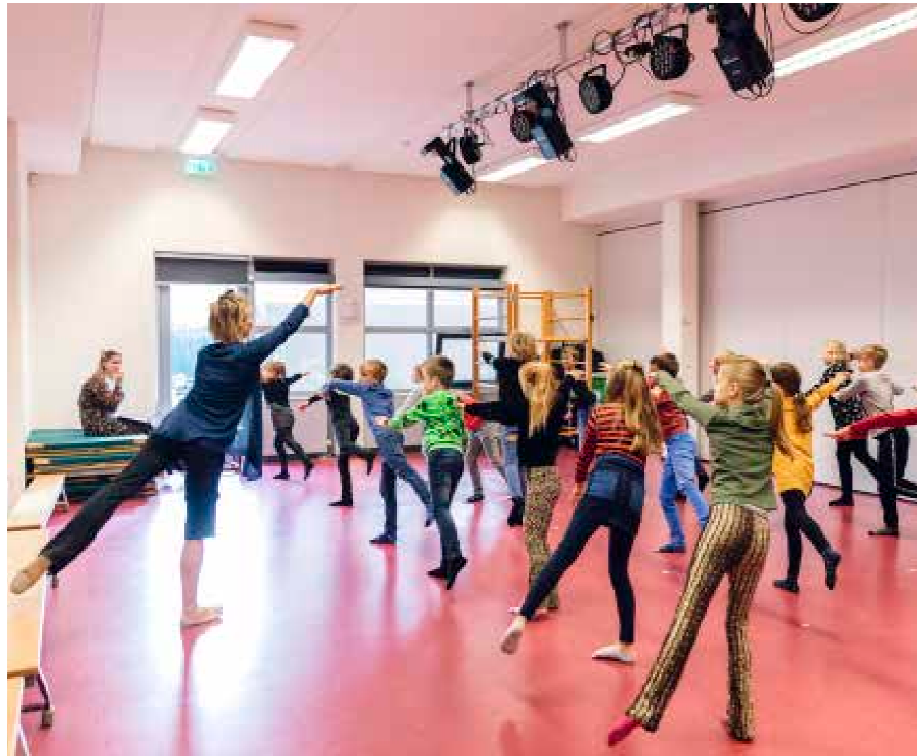
Dansworkshop in Kudelstaart